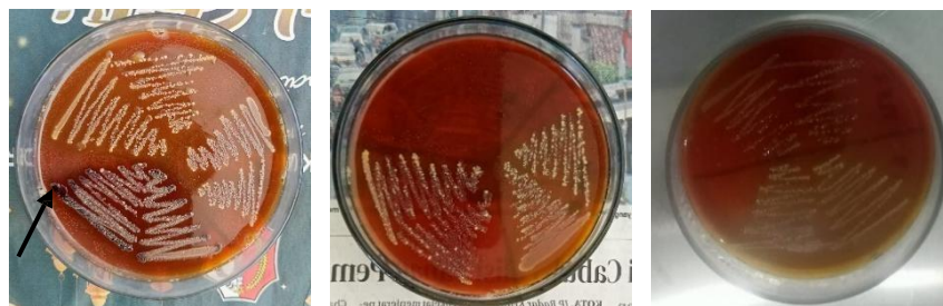
Gambar 1. Hasil Pemiakan pada Media XLD (Tanda Anak Panah Menunjukkan Koloni yang Diduga Bakteri Salmonella sp.)

Koloni yang menunjukkan ciri khas Salmonella sp. pada media XLD selanjutnya diuji biokimia untuk kemudian dilakukan pengamatan pada karakteristik spesifik Salmonella sp.. Berdasarkan hasil pengamatan uji biokimia. pada sampel