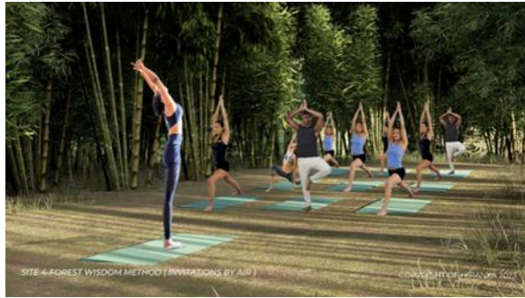
Gambar 6. Site 4 ( Forest Wisdom Method )