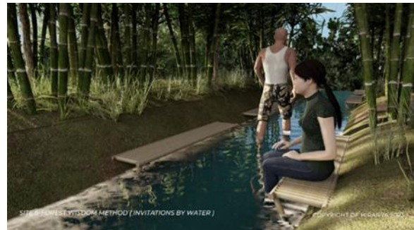
Gambar 8. Site 6 ( Invitations by water )

Kandungan ion negatif banyak dijumpai di daerah-daerah berdekatan dengan air yang bergerak (sungai dan air terjun). Faktor pembentuk dan konsentrasi ion negatif bebas adalah suhu tetesan air, pengotor terlarut, kecepatan ledakan udara yang menimpa, dan permukaan tetesan luar yang menimpa (Ulfa & Muslimin, 2022)