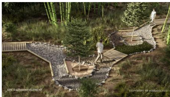
Gambar 7. Site 5 ( Sensory Element )

Site ini digunakan untuk aplikasi Sensory Element, wisatawan melepas alas kaki agar 5 panca inderanya bekerja melewati berbagai element untuk menghidupkan kembali sensasi motoriknya. Dengan mengaktifkan kembali panca inderanya bersinergis dengan hutan, mendapatkan berbagai manfaat dari hutan menerapkan prinsip resiprositas (Clifford, 2018b).