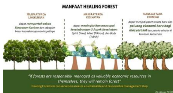
Gambar 1. Manfaat Healing Forest

deforestasi, mewujudkan Indonesia sebagai Green Tourism Destination dan menjadi solusi pariwisata dunia. Apalagi untuk masa pandemik, pengoptimalan ini dapat dilakukan melalui skema ecotherapy healing forest dan perdagangan jasa lingkungan tanpa menghilangkan sedikitpun unsur ekosistem dari hutan itu sendiri.