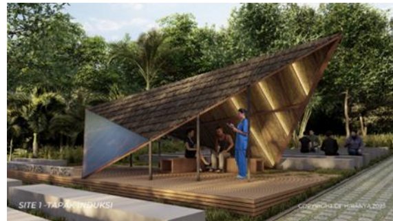
Gambar 3. Site 1 (Tapak Induksi)

Site 1 merupakan tapak induksi, sebagai tempat berkumpul dan pengkondisian awal bagi wisatawan. Interpreter memberikan informasi dan petunjuk tentang pelaksanaan detail kegiatan terapi, termasuk pemeriksaan kesehatan, serta pengkondisian awal bagi wisatawan agar rileks, salah satunya dengan kegiatan tea party (minum teh atau minuman kesehatan khas daerah). teh hijau merupakan salah satu zat antioksidan eksogen (antioksidan dari luar), yang mampu menurunkan stres oksidatif (kondisi dimana terjadi ketidakseimbangan antara oksidan dan antioksidan didalam tubuh sehingga dapat memicu adanya stres psikologis) (Ukty et al. , 2018).