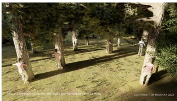
Gambar 4. Site 2 ( Earthing Healing Method )